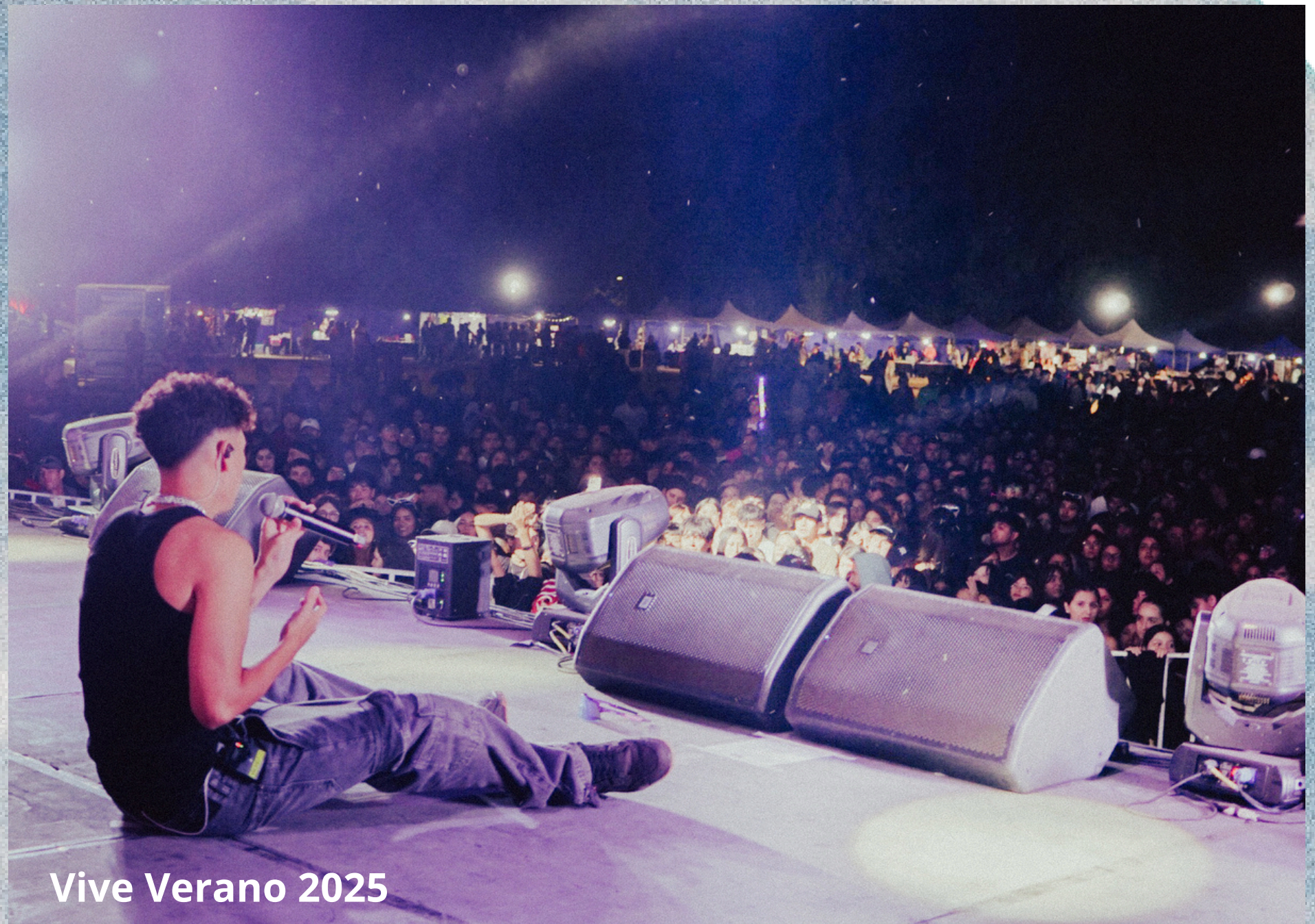
Vive Verano 2025